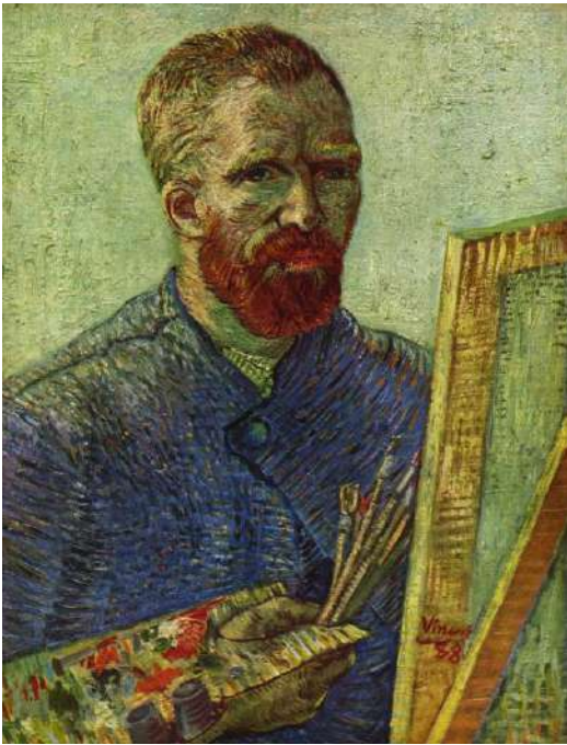
Ван Гог Винсент Виллем